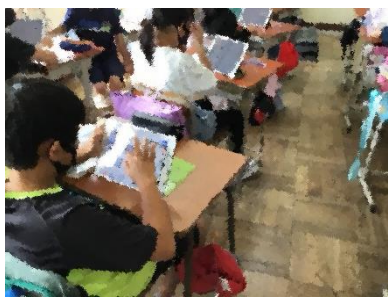
↑【4年生】防災について調べ学習