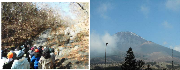
巨大溶岩の滑り台。さすがが門小っ子 大きな滑り台には慣れています。 優美な姿を見せる富士山