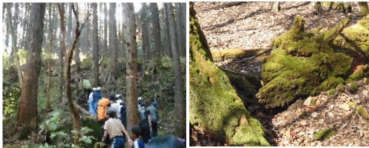
森の中を静かにゆっくり進みます。苔に覆われた倒木。龍の頭のよう。