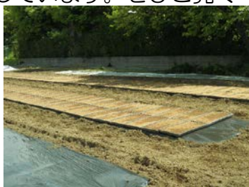
種もみ蒔き後の苗床